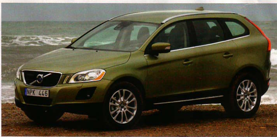
XC60 disainiga hakkab Volvo eemalduma senisest laia aknalauaga disainijoonest. Oli ka aeg.

Tõsi, mõningad mõõndused siiski on: täiesti ohutult suudab auto seisma jääda vaid nn ummikukiirusel ehk kuni 15 km/h. Kui kiirus on juba kuni 30 km/h, ei jää kerge müks tulemata, kuid see on tõesti nii