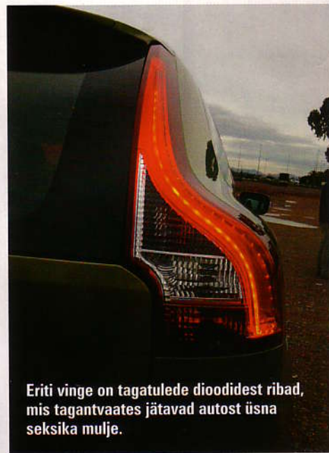
Eriti vinge on tagatulede diodidest ribad, mis tagantvaates jätaavad autost üsna seksika mulje.

Aga tegelikult tahaks öelda hoopis seda, et kui näiteks Mercedese GLK puhul oli ootuste ja lootuste vahekorid igati positiivses bilansis, s.t auto osutus oodatust tublisti paremaks, siis XC60 puhul on asi pisut teistpidi. Või öigem oleks öelda nõnda, et XC60 puhul on Volvo jäänud ikka Volvoks, mitte mingeid erilisi üllatusi. Sõidab hästi, rool on hea, kuid X-kujulise disainiga nahkiste on nagu sohva ja külgtuge kurvilisel teel napib. Samuti on Volvo suure turvatehnika arendamise taustal jäänud pisut ajast maha muu tehnika vallas: diiselmootor tuletab valju plaginaga pidevalt meelde oma vanust, automaatne