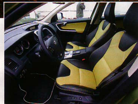
Istmed on nahaga polsterdatud X-kujuliselt, mis tähendab XC-seeriat. Külgtuge aga napib.