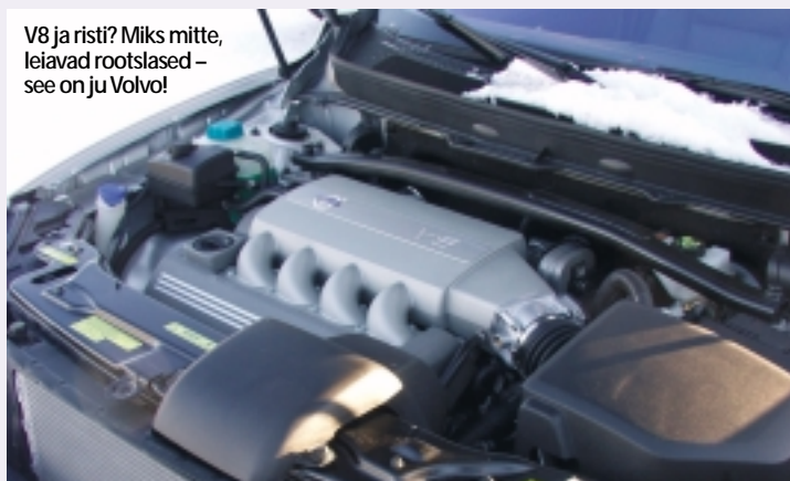
V8 ja risti? Miks mitte, leiavad rootslased – see on ju Volvo!

► Väliselt erineb kaheksasilindriline XC90 tavamudelilt radiaatorivõrel oleva V8-logo, uute 18tolliste velgede, topeltsummutite ja mõningate disaininüansside poolest.