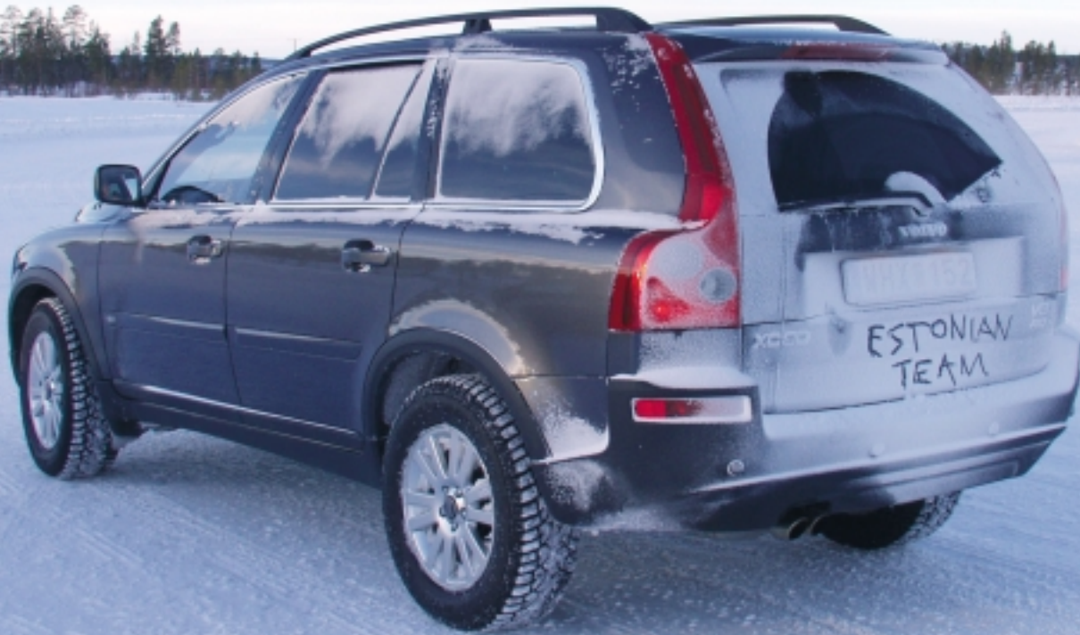
Nagu auto tagaosas ilutsev "hoiatav" kiri teatab, on tegu eestlaste roolitud Volvo XC90 V8-ga polaarjoone taga lvalos asuval Mellatracks Test Worldi trassil!

erandit ei tehtud ka seekord. See on ka põhjuseks, miks ei võetud kasutusele mõnda juba olemasolevat Fordi kontserni mudelitel (mõni USA turu Ford, aga ka Jaguar või Land Rover) kasutatavat jõuallikat – pikiasetuseks ette nähtud mootorid ei mahuks lihtsalt ära. Samuti soovis Volvo iga hinna eest säilitada XC90 turvatsoone – on ju just turvalisus Volvo põhiloosungiks. See põhjendab ka silindritevahelise 90-kraadise nurga asemel 60kraadise kasutamist – iga sentimeeter on arvel. Tulenuseks on äärmiselt kompaktne jõuallikas, millel pikkust 754, laiust aga vaid 635 mm. Et nii silindriplokk kui plokikaas on alumiiniumsulamist, väärrib mainimist ka vaid 190 kg mass. Vaa-